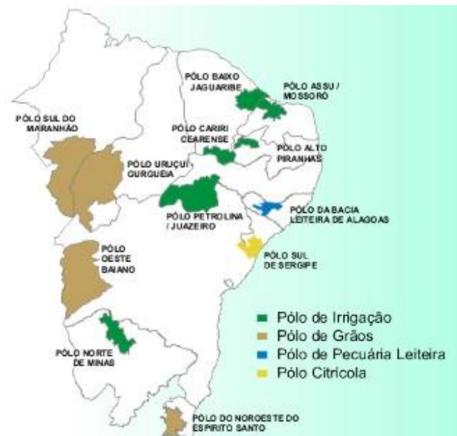
FIGURA 1. Polos de Desenvolvimento de Agronegócios do Nordeste (PDAs)